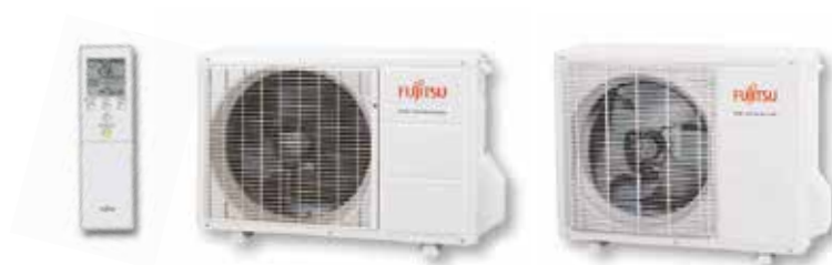
ASY 25 Ui-LT